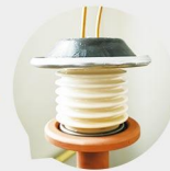
特质陶瓷管 SPECIAL CERAMIC TUBE