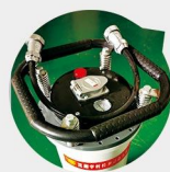
机壳超轻材质 ULTRALIGHT MATERIAL