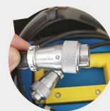
高品质配件 HIGH-QUALITY ACCESSORIES